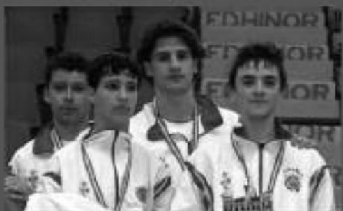
CAMPEONES FASE NACIONAL SUB-15 SUBCAMPEONES DE ESPAÑA SUB-15